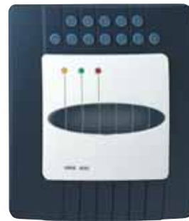
ORIS plus Zusatzblende mit PIN-Code-Tastatur ORIS plus additional panel with PIN code keyboard