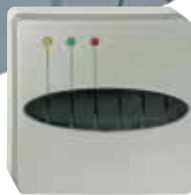
ORIS mit Aufputzrahmen ORIS with surface socket frame