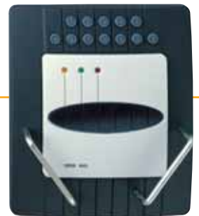
ORIS plus Zusatzblende mit PIN-Code-Tastatur und Kartenhalter ORIS plus additional panel with PIN code keyboard and card holder