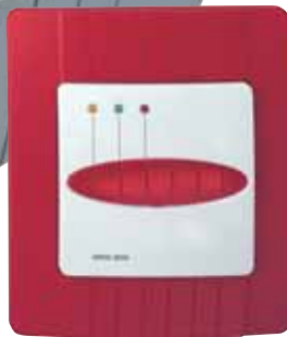
ORIS plus Zusatzblende ORIS plus additional panel